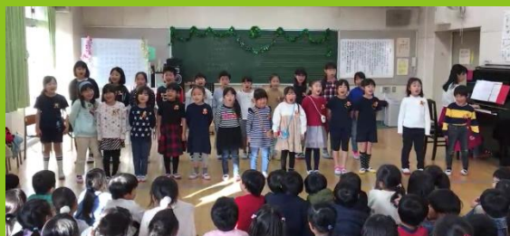
♪ジングルベル、サンタが街にやってくる、赤鼻のトナカイ

練習を重ねた、はまっ子合唱団のXmasソングで、ぐっとクリスマスの雰囲気…。みんなが楽しみにしているビンゴ大会は、今年も大いに盛り上がりました。さいごは、みんな大好きな♪パプリカを、歌って踊って、楽しみました。