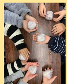
どれが1番美味しそう？