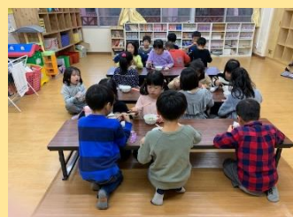
食べている時は静かです！