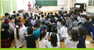
恒例の大ビンゴ大会！

12月25日（水）音楽室で、クリスマス会を開きました。たくさんの子が参加してくれました。4人の子どもたちが、特技を見せてくれて、みんなを楽しませてくれました。ありがとう！