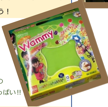
サンタさんからのプレゼントもいっぱい!!