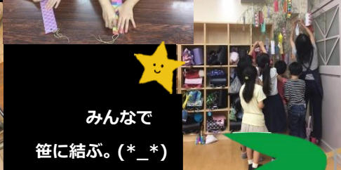
みんなで 笹に結ぶ。(*_*)