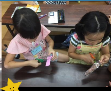
短冊にねがいを込めて書いてます。