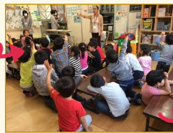
「わかったかな!?」「はーい！」