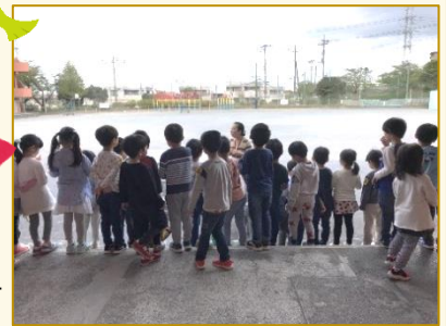
はまっ子倉庫には、一輪車・ボール