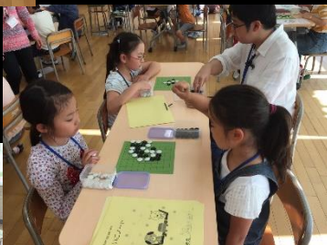
16時から、初心者と2年目さんが別々に学びます